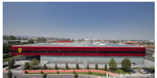
la façade du bâtiment

Style, fonctionnalité, efficacité et innovation sont les lignes fortes du projet architectural, avec comme objectifs d'améliorer les conditions de travail et de faciliter la cohabitation des différentes activités abritées par le bâtiment. Trois typologies de flux coexistent en effet dans ce lieu : les employés de la GeS, les visiteurs extérieurs et les flux de matériaux et de produits. L'un des défis majeurs du projet a été de les organiser en proposant un agencement efficace et harmonieux des espaces.