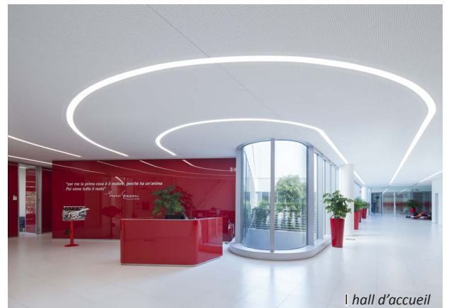
le hall d'accueil